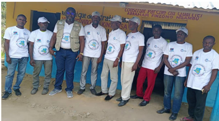
Le Chef de Cellule de Communication avec l'équipe des mobilisateurs recrutés à DUMI

La sensibilisation de la population a été facilitée par les crieurs (mobilisateurs) du quartier à l'aide des mégaphones en insistant sur le bon accueil des équipes dans les ménages. Les membres des équipes avaient également le rôle de sensibiliser les membres des ménages en leur expliquant le but de leur passage dans les ménages. En plus des crieurs, les équipes étaient accompagnées par huit guides, à raison de deux guides par équipe.