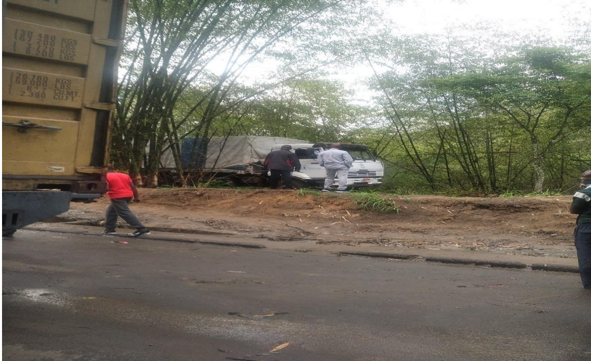
Embouteillage au niveau du pont Maindombe.