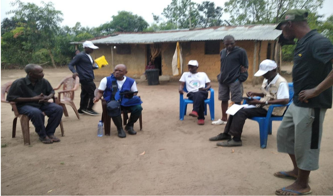
Rencontre de l'équipe B du site DUMI avec le chef du village Ikiene