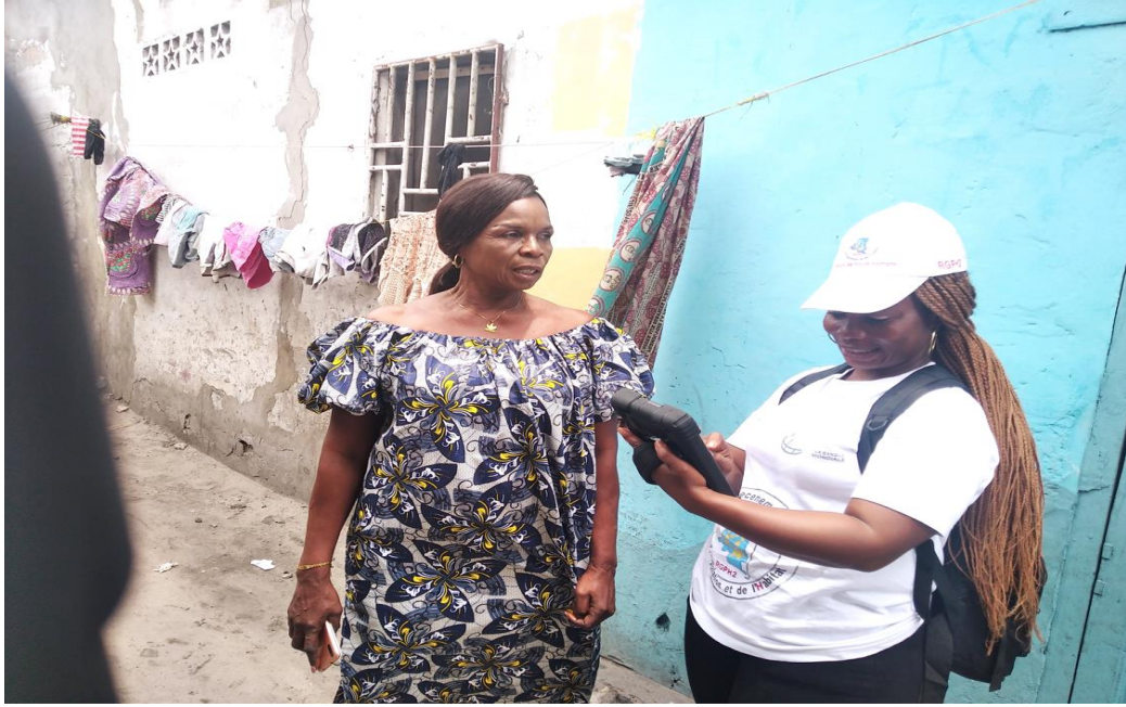
Collecte des données par un opérateur cartographe dans le site de PETI-PETI.