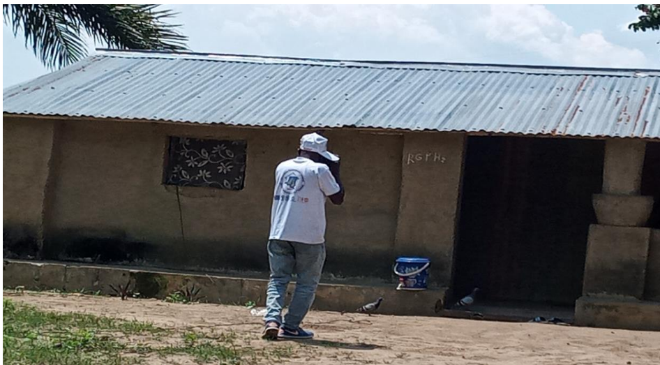
Mention RGPH2 sur une maison de rendre efficace le système de balayage et éviter le double compte

Concernant la progression des équipes sur le terrain, l'équipe A du quartier PETI-PETI et les équipes de DUMI ont recouru au système de balayage afin de boucler les ilots qui leur avaient été attribués. L'équipe B du quartier PETI-PETI quant à elle a recouru aux deux méthodes, l'affectation de l'ilot à chaque opérateur cartographe et au système de balayage pour les trois ilots restants.