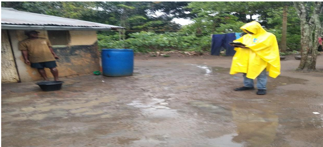
Collecte des données par un opérateur cartographe devant un ménage sous la pluie.