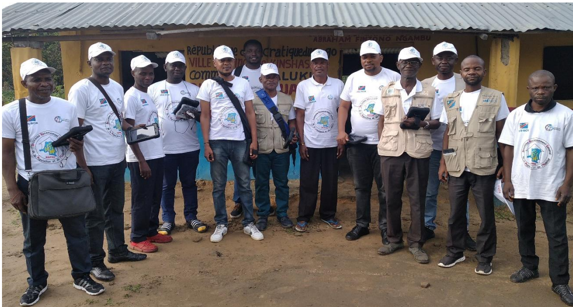
Photo d'ensemble avec le chef du Quartier Dumi devant le Bureau du Quartier.