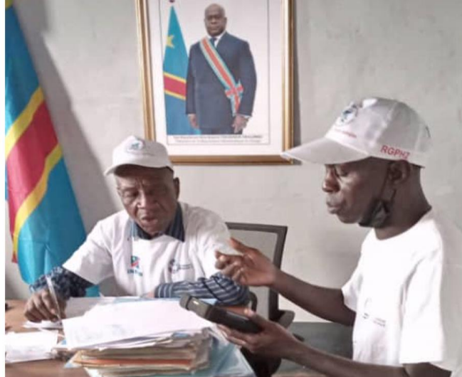
Administration de la fiche Village/Quartier à Peti-Peti