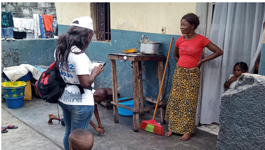
Administration de la fiche ménage à Peti-Peti, Ngiri-Ngiri, Kinshasa

Le quartier PETI-PETI avait au total 18 ilots dont 9 pour l'équipe A et 9 autres pour l'équipe B.