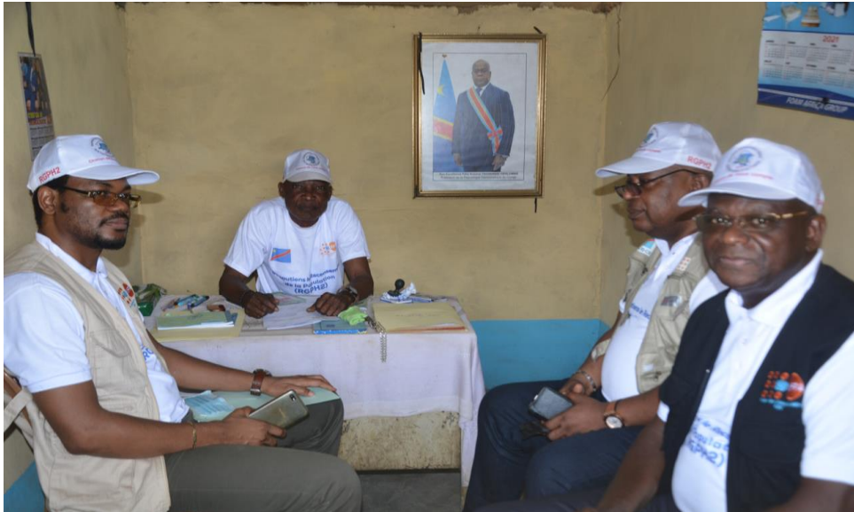
Equipe de coordination technique au Bureau du quartier DUMI, Maluku, Kinshasa

supervision était sur terrain pendant les quatre jours. Les descentes dans le quartier DUMI se sont faites le 24 octobre par les chefs des divisions de la cartographie et de l'Informatique, et le 26 octobre 2021 par la Coordination, le Conseiller Technique Principal, le chef de la division collecte traitement et analyse, les cadres de la cellule du suivi-évaluation et de l'Assistant du Coordonnateur Adjoint chargé des questions techniques.